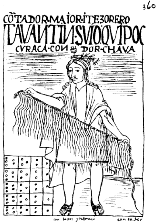
Figura 2. Imagen de un quipucamayoc o “contador y tesorero” según la Nueva Corónica y buen gobierno del cronista indígena Guamán Poma de Ayala. Se puede ver el quipu y su uso. Además, el ábaco está representado en la esquina izquierda inferior.

resultado se contabilizaría a través de un nudo en una cuerda del quipu . Para llevar el quipu , una serie de cuerdas se ataron juntas formando un collar. Singularmente, el quipu tenía categorías de intercambios por el color de la cuerda y la longitud de la misma ordenada por nombres de pueblos, luego animales y objetos. Como resultado, los curacas (los jefes locales) llevaban este instrumento parecido a un collar, ya que mantenían la responsabilidad de recordar los intercambios y comunicar la información hacia arriba. Este intrincado registro podría deberse al conocimiento andino por cómo el estado inca se desarrolló tan rápidamente. (Rostworowski 2005:39-40)